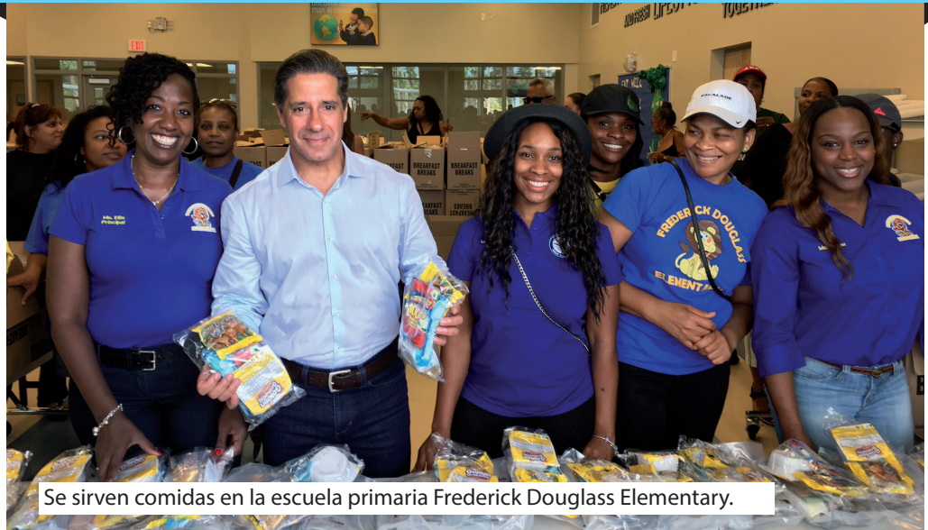
Se sirven comidas en la escuela primaria Frederick Douglass Elementary.

El huracán Irma fue una de las tormentas más poderosas que impactara el sur de la Florida en la historia reciente. Las contribuciones de cada rama de la familia M-DCPS proporcionó una red de protección en toda la comunidad para los necesitados mientras enfrentábamos la incertidumbre del impacto de la tormenta. La evacuación y operación de los refugios fueron sin precedentes en su alcance, magnitud y eficacia. Más de 30,000 miembros de la comunidad buscaron refugio en uno de los 44 planteles escolares que abrieron como refugios. Tan pronto pasó Irma, dedicamos nuestra