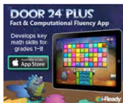
Door 24 Plus

For extra math and vocabulary practice, try our FREE Apps, available from the iTunes store.