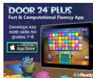
Door 24 Plus

Para más práctica de matemáticas y vocabulario, prueba nuestras aplicaciones GRATIS, disponibles en la tienda de iTunes.